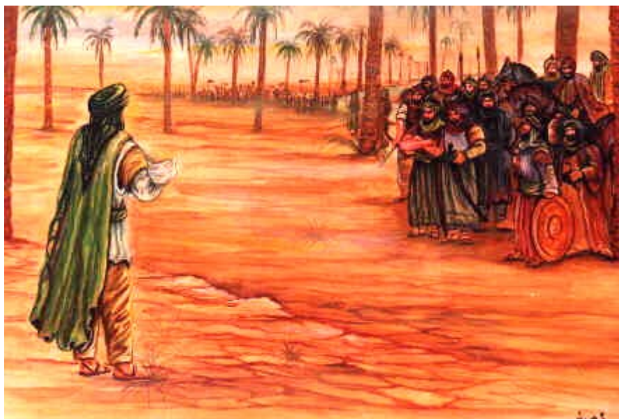
Imam Hussain (a.s.) akilikutubia jeshi la 'Umar ibn Sa'ad (AL) kabla ya kuanza kwa Vita