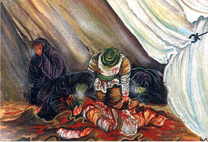
Imam Hussain (a.s.) akizileta maiti za waliouawa Shahidi katika mahema yao.