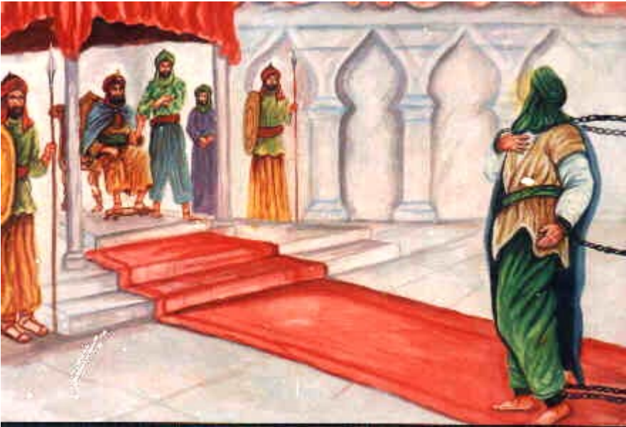
Imam 'Ali Zayn Ali 'Abidin (a.s.) akimhutubia Yazid (AL) katika baraza lake