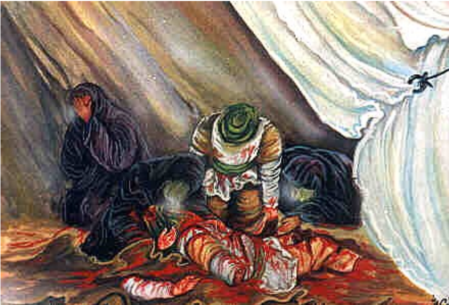
Imam Hussain (a.s.) akizileta maiti za waliouawa Shahidi katika mahema yao.