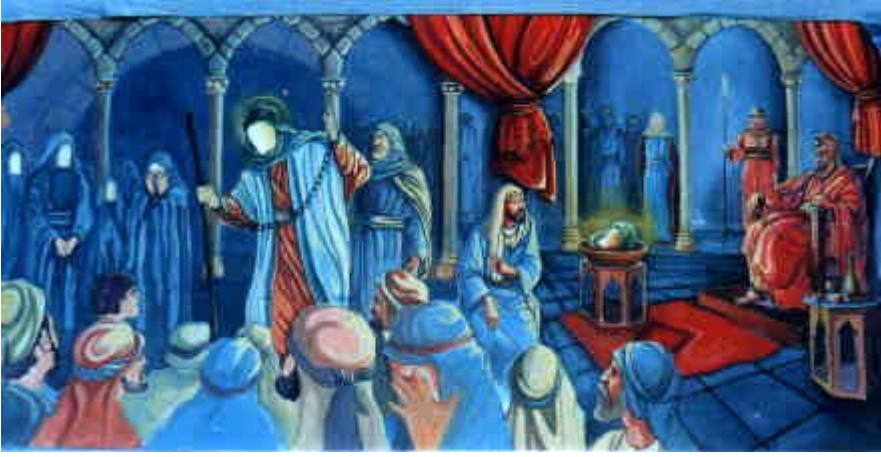
Imam 'Ali Zayn al-'Abidin (a.s.) akiwa katika baraza la Yazid ibn Mua'awiyaah (AL) huku kichwa cha Imam Hussain (a.s.) kikionyeshwa