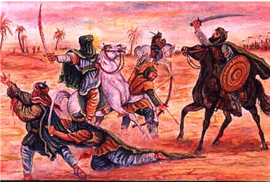
Vita pamoja na maadui