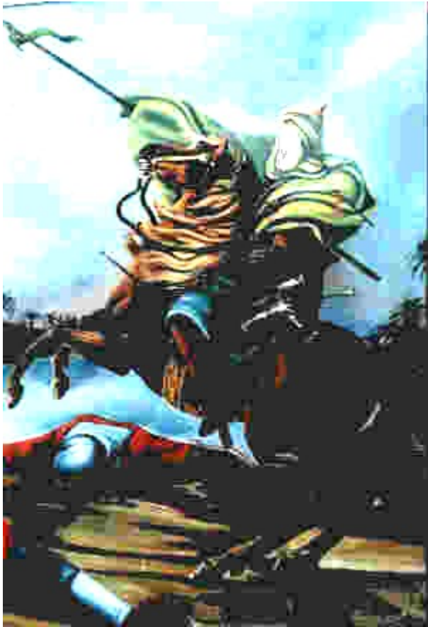
Imam Hussain (a.s.) akiwa vitani