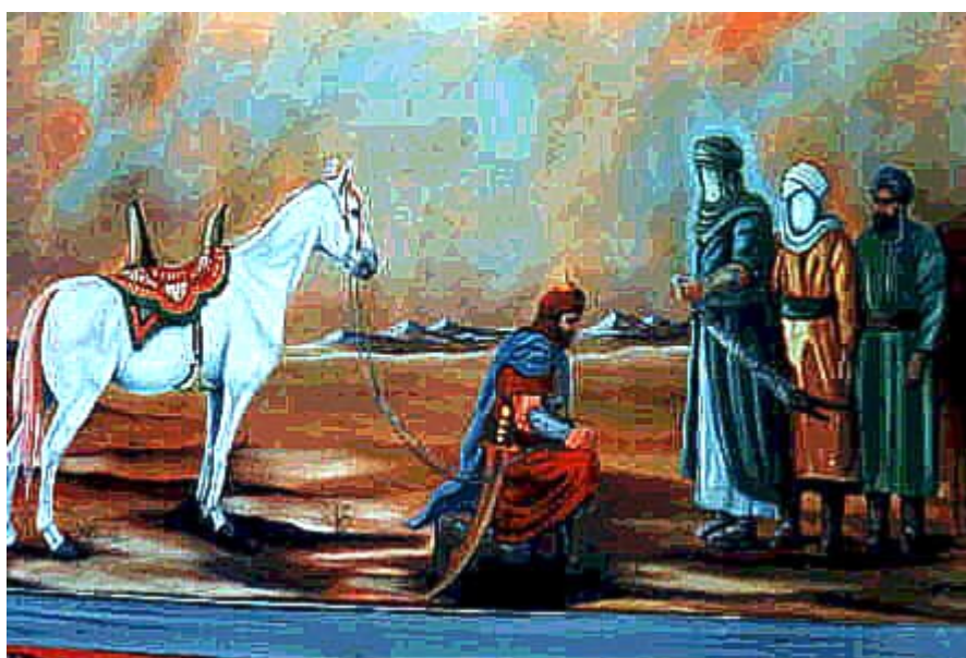
Imam Hussain (a.s.) akikubalia bay'a ya watu wawili. Hur (A) akiomba msamaha na kujiunga na kambi ya Imam Hussain ( a.s.)