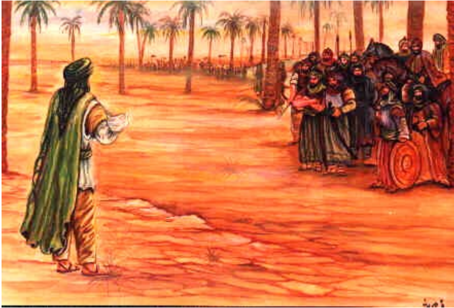
Imam Hussain (a.s.) akilihutubia jeshi la 'Umar ibn Sa'ad (AL) kabla ya kuanza kwa Vita