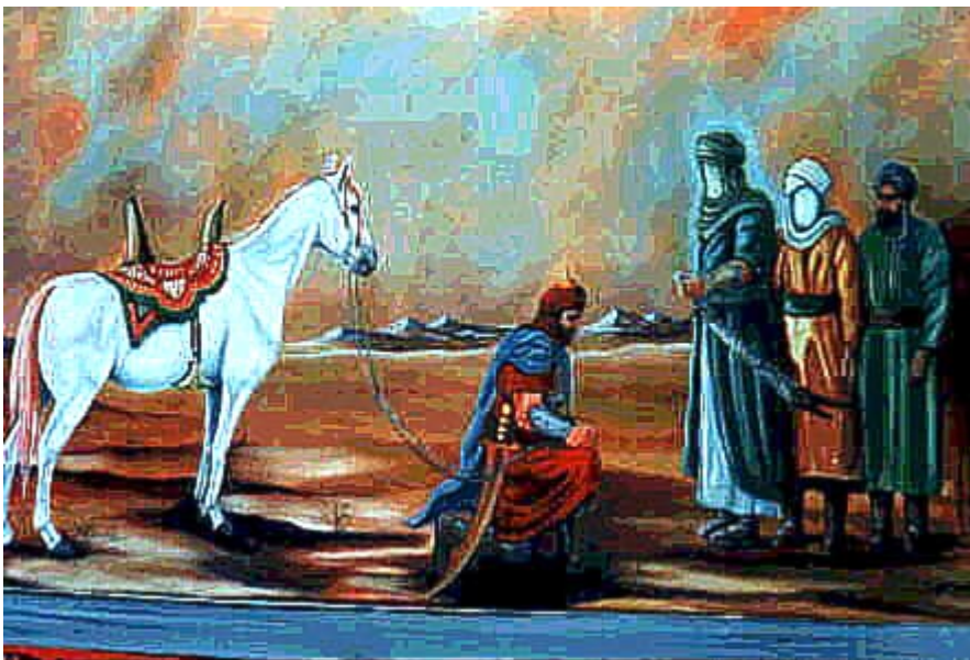
Imam Hussain (a.s.) akikubalia bay'a ya watu wawili. Hur (A) akiomba msamaha na kujiunga na kambi ya Imam Hussain ( a.s.)